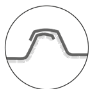
Recouvrement sans feutre

Pour une pente de toiture inférieure à 20°, une façon de goutte pendante est indispensable. Elle est formée sur l'aile inférieure avec un angle de 45 à 60° et orientée vers le bas, à la pose.