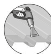
Fusion à l'aide d'un foehn à air chaud